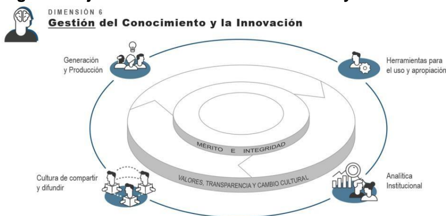
Imagen 1 – Ejes del Gestión del Conocimiento y la Innovación

La transversalidad de la Dimensión es posible con el compromiso del desarrollo sistemático de los cuatro (4) ejes de Gestión del Conocimiento y la Innovación que establece el Modelo Integrado de Planeación y Gestión, su aplicación permitirá de una manera organizada recopilar la información, analizarla clasificarla, almacenarla, colocarla a disposición de los usuarios, compartirla y difundirla. Cada eje permitirá que cada una de las acciones se encuentre proyectada a procesos de aprendizaje y mejoramiento continuo de la entidad.