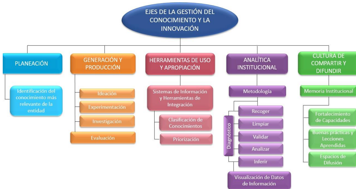
Imagen 13 – Ejes de la Gestión del Conocimiento y la Innovación