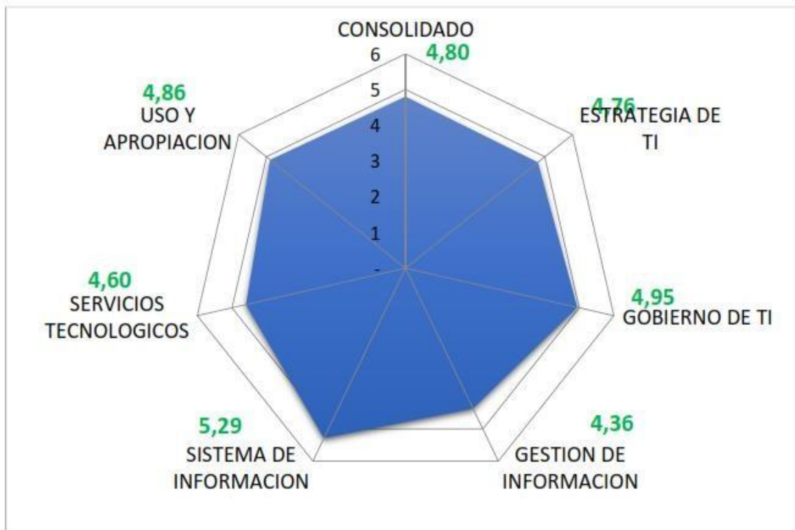
Ilustraci3n 6. Ruptura Estrat3gica 2021-2024

De acuerdo con la ponderaci3n de 0 a 6, donde 0 indica que no se aplica el criterio, 1 se aplica muy poco y 6 se aplica totalmente, se obtiene que actualmente la Entidad en esta escala presenta una madurez sobre los 6 dominios calificados as3: