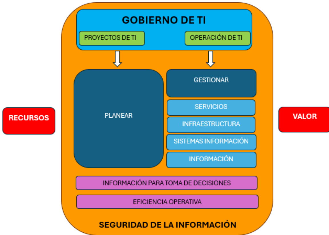
Ilustración 3. Modelo de Gestión TI