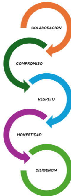
Ilustración 2. Valores trece