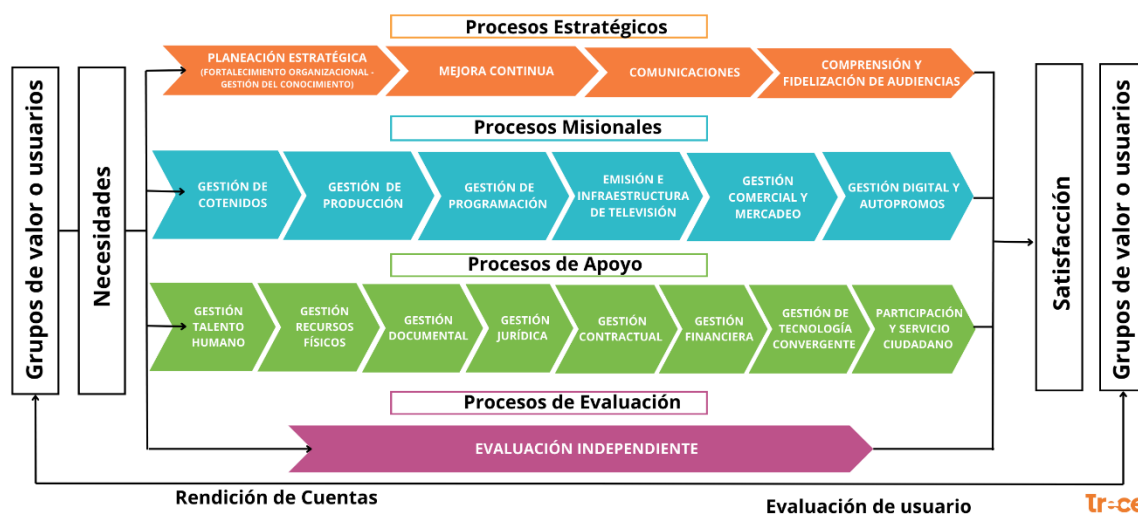
Ilustración 1 Mapa de Procesos

Este mapa ilustra cómo cada proceso contribuye al cumplimiento de los objetivos organizacionales, asegurando la alineación con las necesidades de los usuarios y la mejora continua de los servicios ofrecidos.