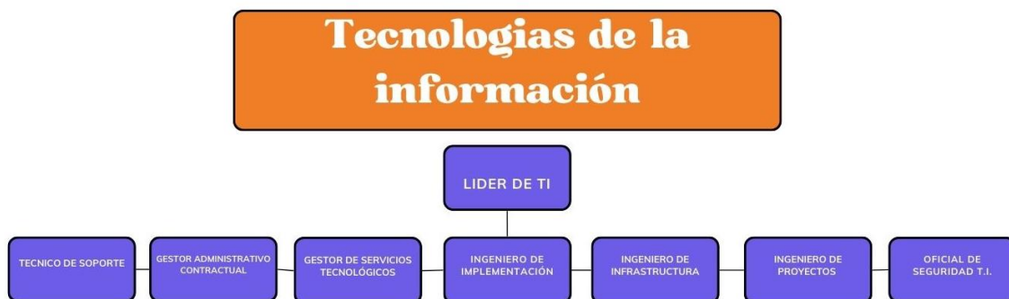
Ilustración 4. organigrama TI